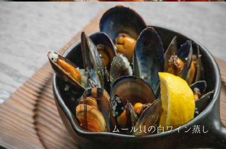
ムール貝の白ワイン蒸し