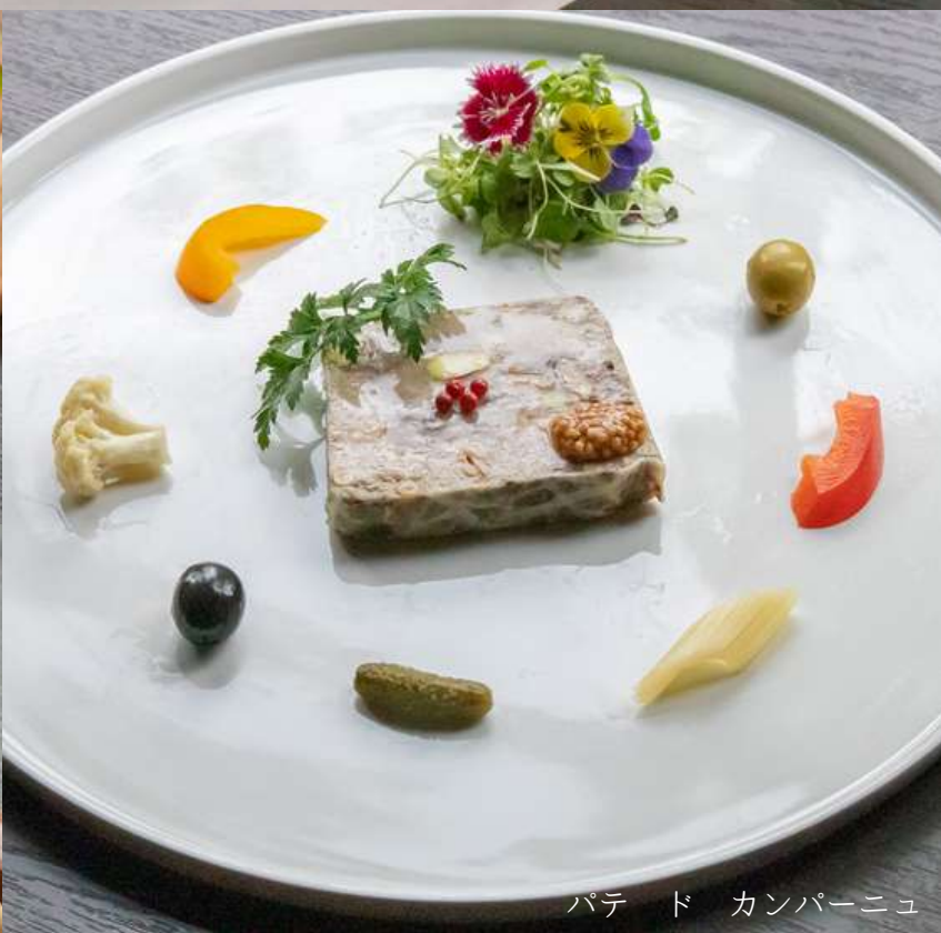
パテ ド カンパーニュ