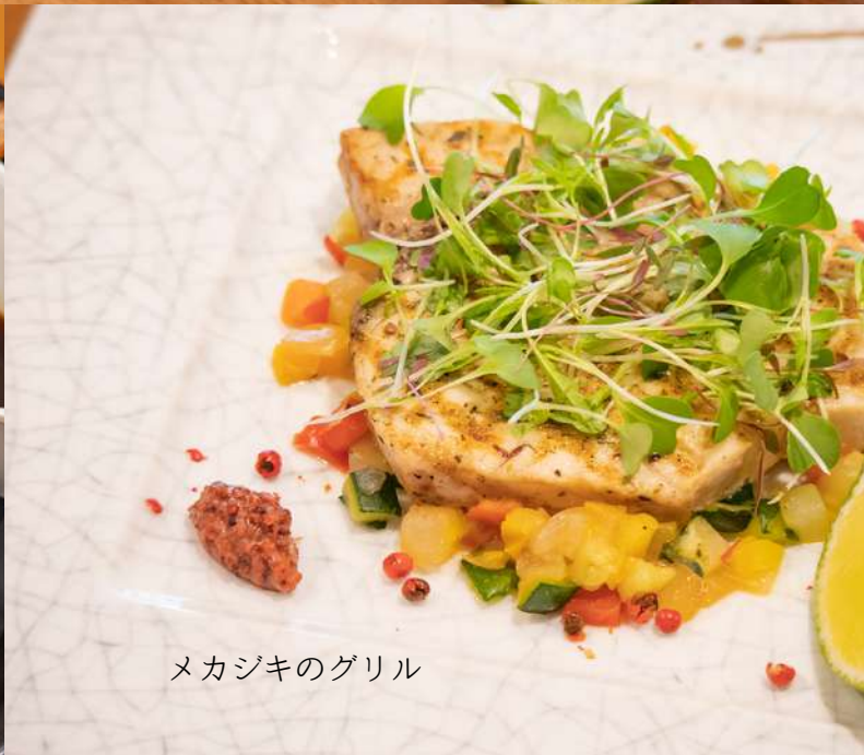
メカジキのグリル