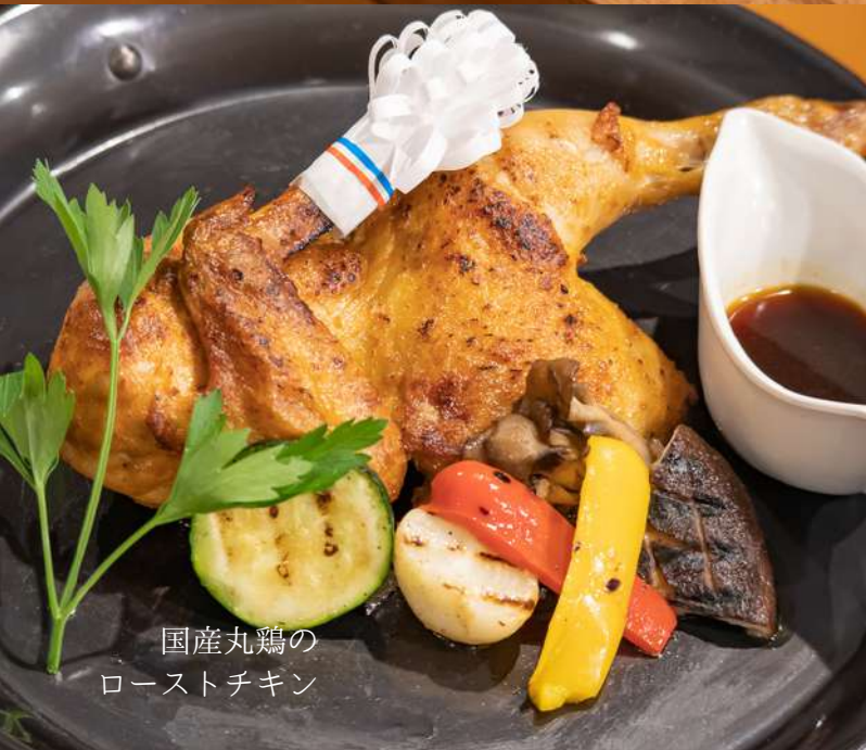
国産丸鶏の ローストチキン