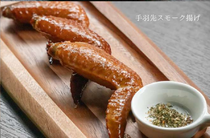
手羽先スモーク揚げ