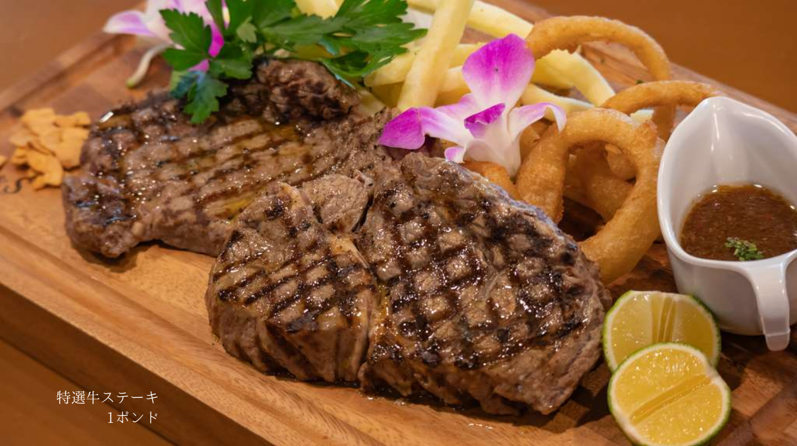
特選牛ステーキ 1ポンド